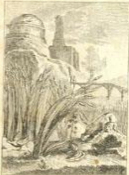
La Fontaine, Table CLXXIX. L'écroule à N° de la Vallée